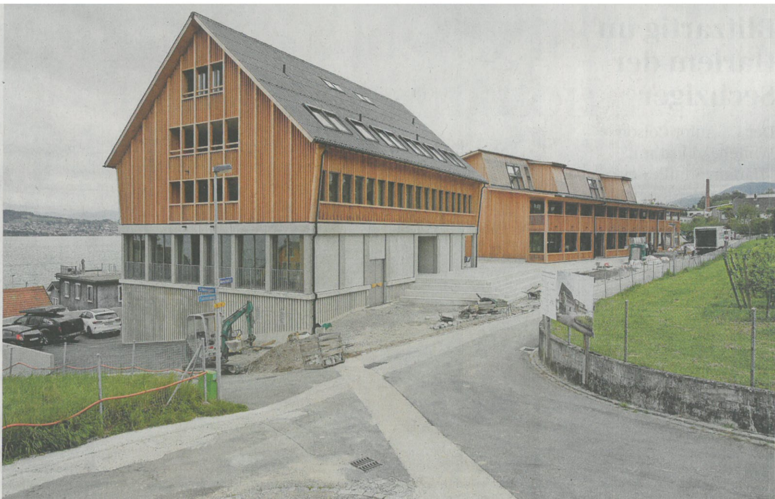
Bezugsbereit: Die meisten Zimmer im neuen Studentenwohnheim sind bereits vermietet.

Stimmen Sie online ab: www.linthzeitung.ch