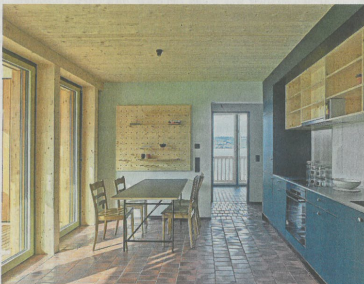
Treffpunkt: In den Küchen können sich die Studenten zum gemeinsamen Kochen treffen.

Im Erdgeschoss planen die Architekten eine Gemeinschaftsküche mit Aufenthalts- oder Essbereich. Im 2. bis 5. Obergeschoss sollen die Studios mit Badezimmer und kleiner Einbauküche realisiert werden. Die Bauherren wollten sich zum Projekt noch nicht detailliert äussern.